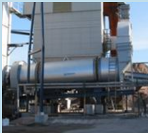
Torktrumma på asfaltsverk

Exempelvis cistern, brunn, processkär, avlopps-, gas- eller vätskeledning, fläktrumma, hissgröp, kulvert, källarutrymme, torktrumma, betongblandare, ballastficka, eller installationsutrymmen i/under maskiner eller liknande.