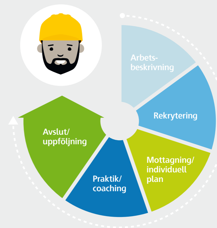
Arbetsprocess för praktikplatser.

Från dag ett var fokus att guida varje person till ett jobb, och dessutom rätt jobb.