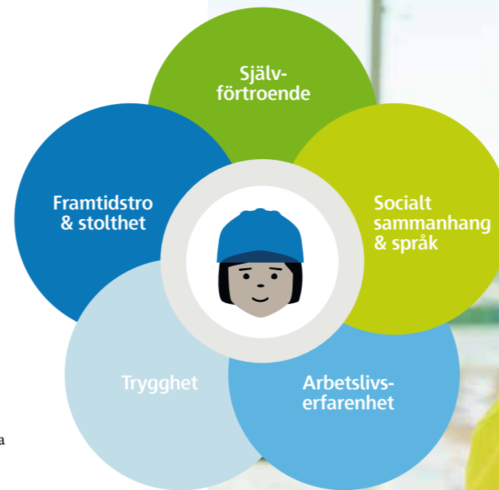
Effekter för praktikanterna.

”Jag har fått uppgifter som passar mig och fått stöd i att utvecklas. När jag går vidare i arbetslivet kommer jag nog ha lite andra förväntningar på en arbetsgivare än jag haft innan för att jag vet hur bra det faktiskt kan vara. Nu kommer jag mer aktivt leta efter en arbetsplats som stödjer mig i min utveckling och som har en positiv anda.”