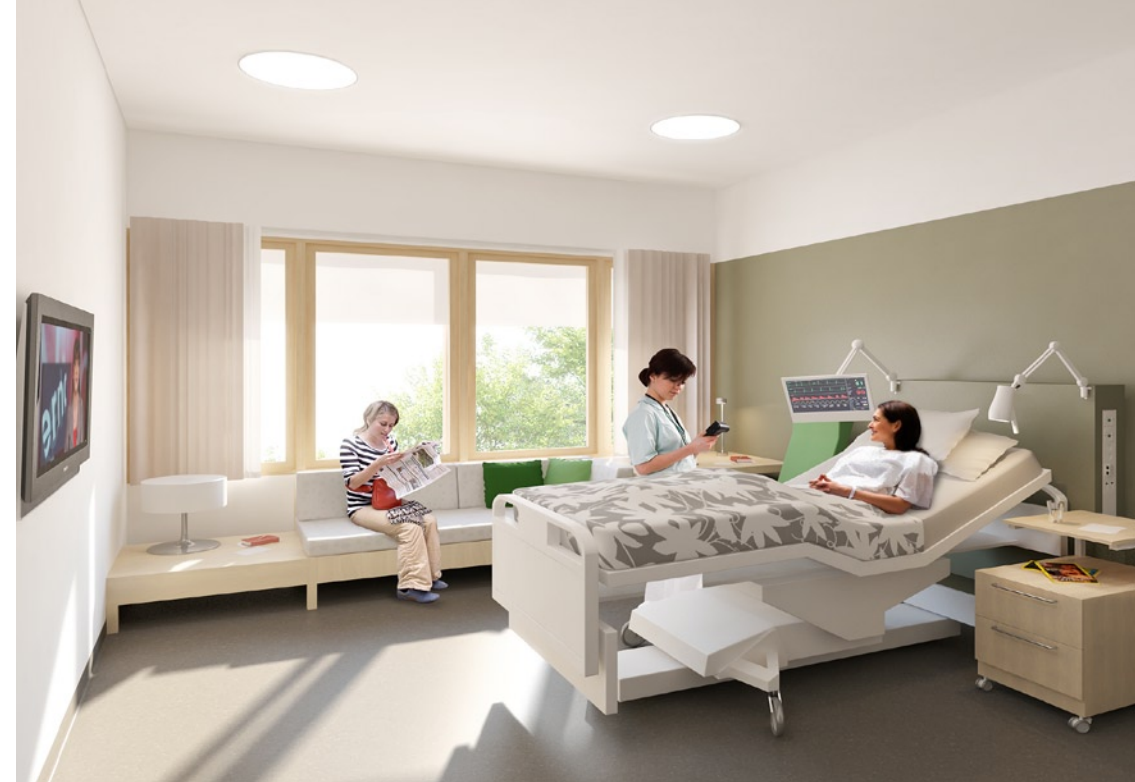
Alla patienter får enkelrum.