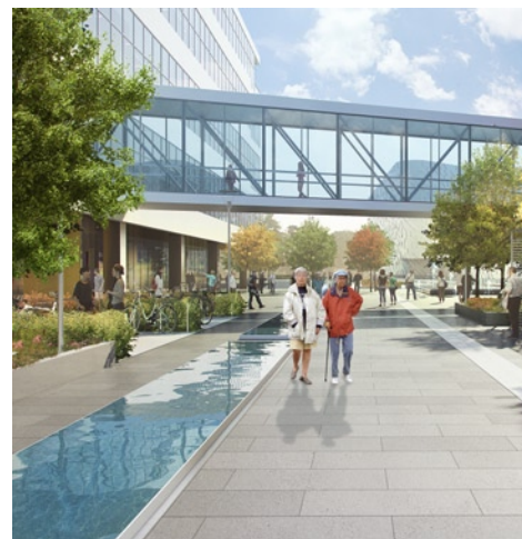
Akademiska stråket förbinder sjukhusparken med Karolinska Institutet via en ekodukt över Solnavägen.

Sjukhuset kommer att uppfylla kraven för LEED-certifiering – ett av världens ledande system för miljöcertifiering av byggnader.