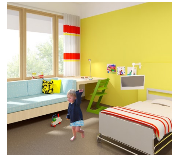
En del av sjukhuset utformas för barnsjukvård med anpassade lokaler.