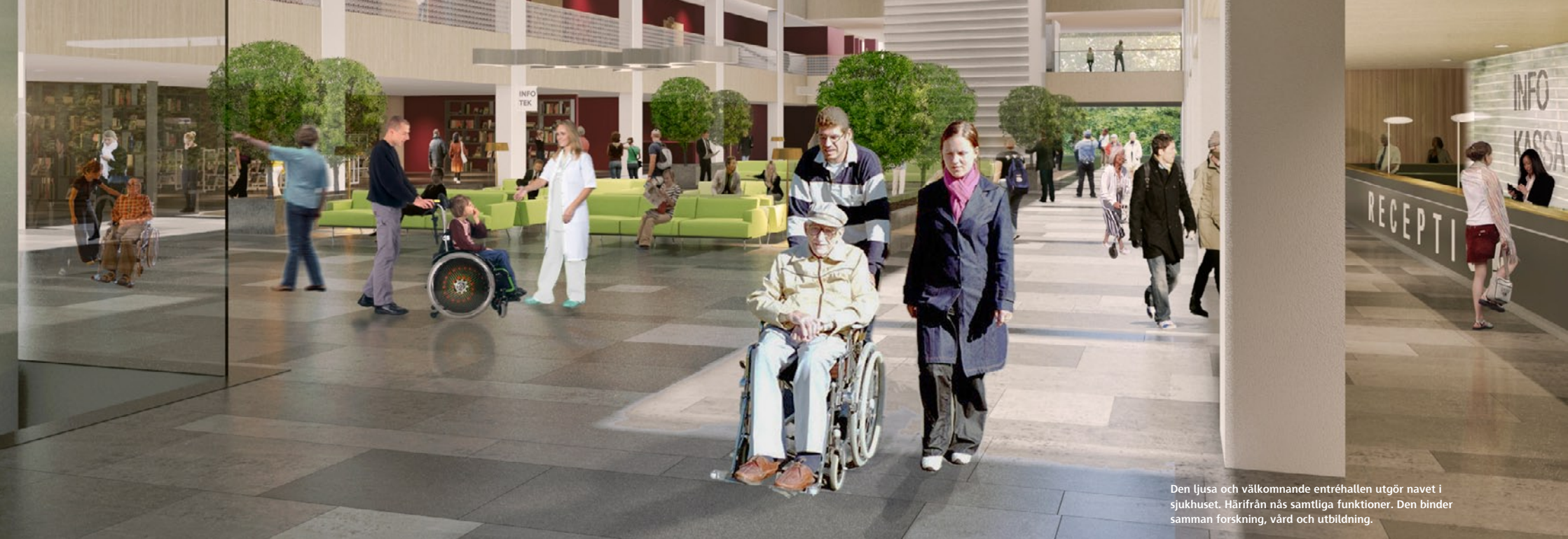
Den ljusa och välkomnande entréhallen utgör navet i sjukhuset. Härifrån nås samtliga funktioner. Den binder samman forskning, vård och utbildning.