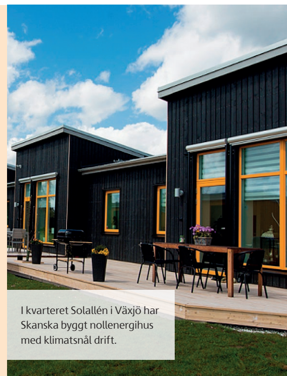
I kvarteret Solallén i Växjö har Skanska byggt nollenergihus med klimatsnål drift.

mål att skapa förutsättningar för ett socialt hållbart boende med extra kvalitéer, så som bland annat ett eget parkrum för de boende. Även här låg byggandet i framkant ur ett miljöperspektiv och ett äldreboende byggdes som ett nollenergihus. Genom arbetsmarknadsinsatser kunde även ett antal platser för praktikanter tillsättas för personer som stod långt från arbetsmarknaden.