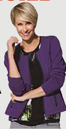
LILA JACKA 729:-

Fina kvaliteter • Bra priser • Alla storlekar